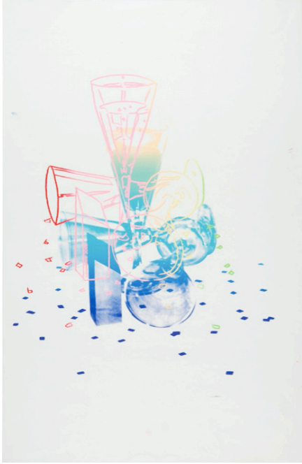
Andy Warhol « Committee 2000 », 1982