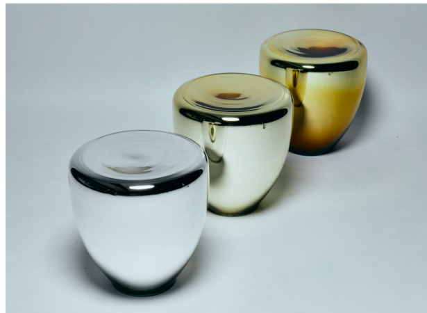
Reda Amalou « Table d'appoint Dot », 2018