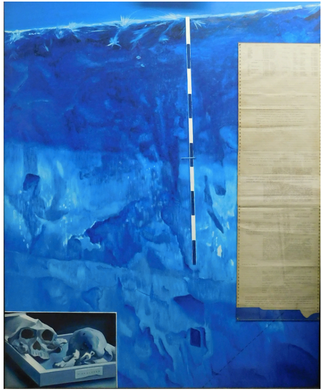
Jacques Monory « Death Valley N°7 », 1975