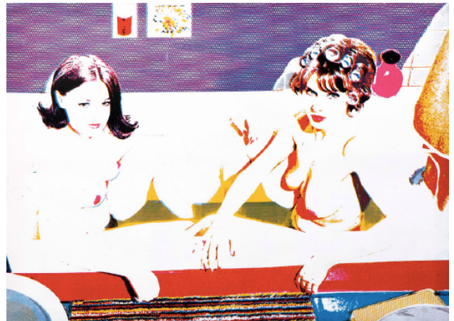
Alain Jacquet «Gaby d'Estrées », 1965