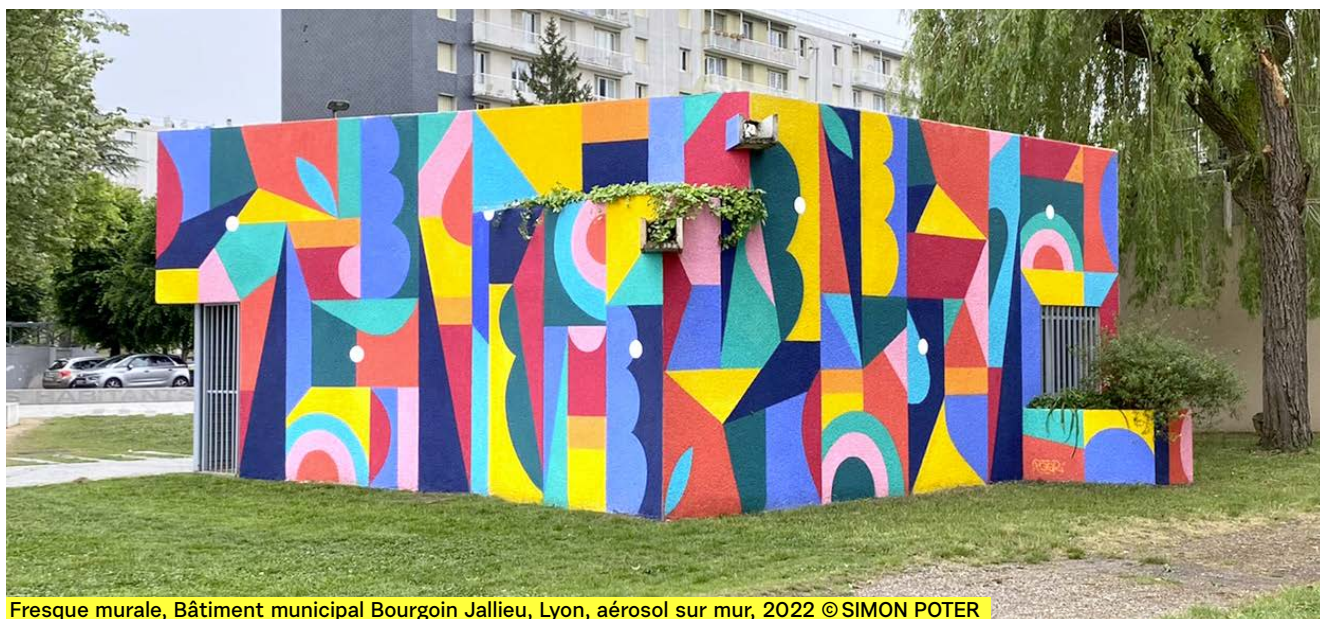
Fresque murale, Bâtiment municipal Bourgoin Jallieu, Lyon, aérosol sur mur, 2022 © SIMON POTER