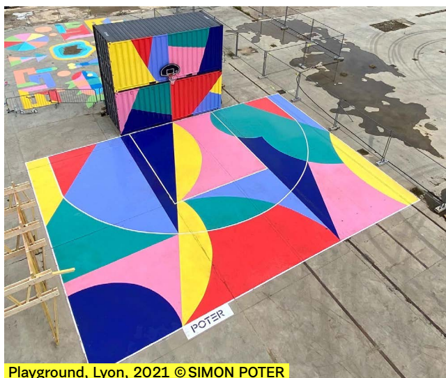
Playground, Lyon, 2021 © SIMON POTER

Simon Poter s'est initié au graffiti avant une formation plus classique aux Beaux-Arts de Lyon. Ses compositions jouent de l'abstraction polychrome, avec une dynamique de formes mosaïques dont le mouvement est provoqué par la tension du trait et le contraste des aplats de couleurs. Son style graphique, une géométrie où la couleur fait figure d'unité de mesure, lui ouvre les portes de collaborations avec des marques emblématiques de la culture urbaine. Régulièrement invité pour des réalisations murales, dans le cadre de festivals ou de commandes institutionnelles, il développe parallèlement en atelier une œuvre qui transcrit cette intensité multicolore de motifs abstraits à l'échelle de la toile. Simon Poter a collaboré avec Quai 36 dans le cadre du projet architectural Entract' pour la construction de la résidence Artchipel à la Garenne-Colombes en dévoilant une fresque monumentale conçue comme une rythmique de jazz vibrante, dans laquelle les couleurs auraient remplacé les notes.