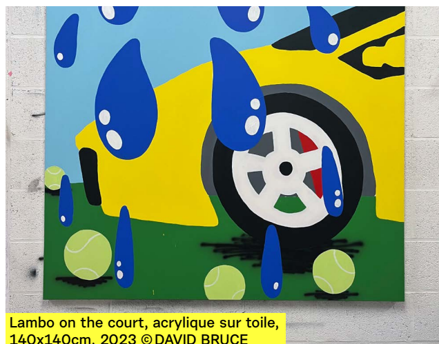
Lambo on the court, acrylique sur toile, 140x140cm, 2023 © DAVID BRUCE