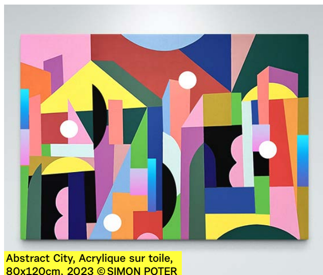
Abstract City, Acrylique sur toile, 80x120cm, 2023 © SIMON POTER