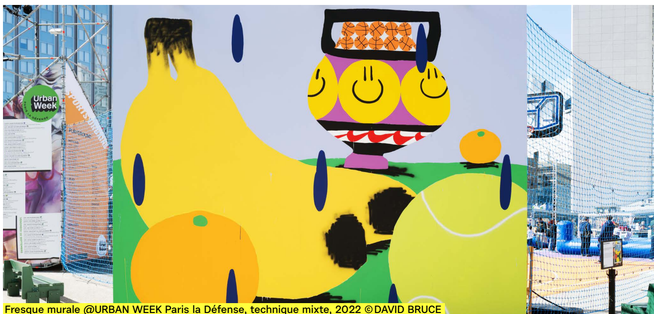
Fresque murale @URBAN WEEK Paris la Défense, technique mixte, 2022 © DAVID BRUCE