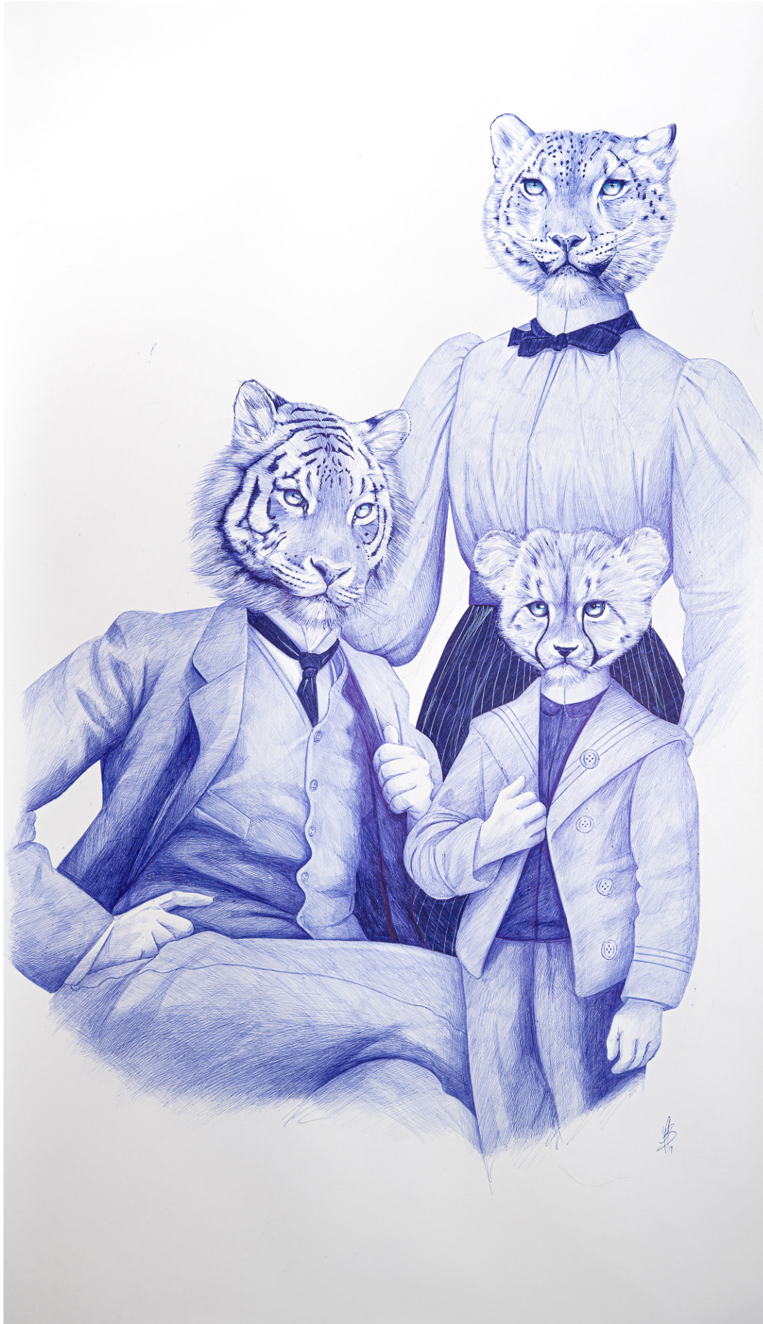
NELSON FAMILY 200 x 114 cm Bic sur papier Arches 300gr 2019