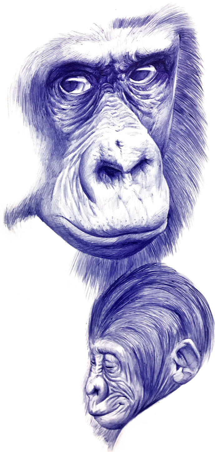
MAMA LOVE 5 76,5 x 57 cm Bic sur papier Arches 300gr 2019